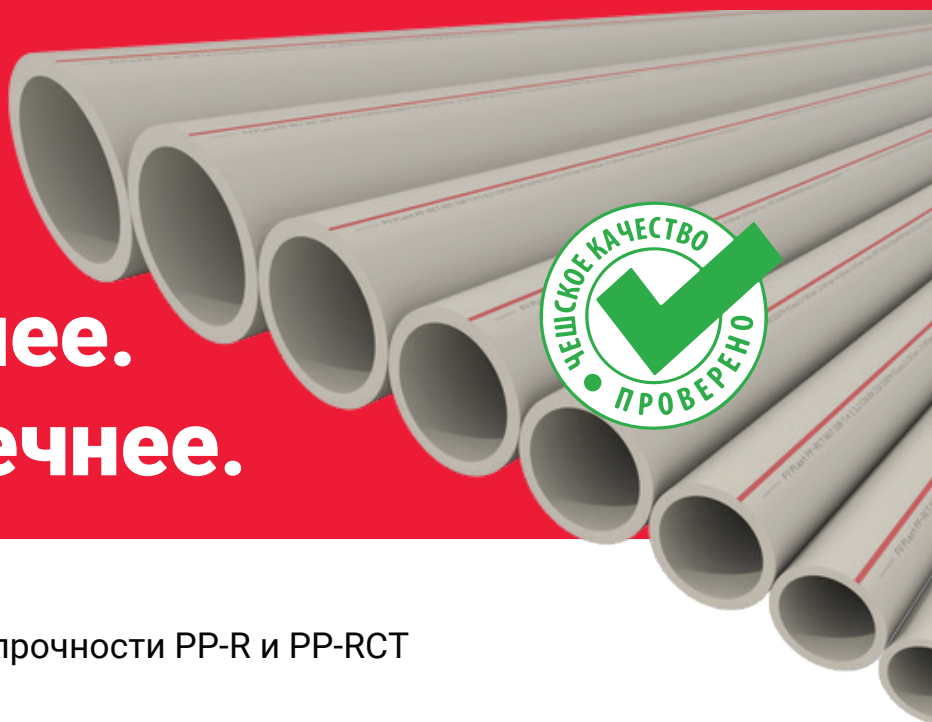
Сравнение длительной прочности PP-R и PP-RCT