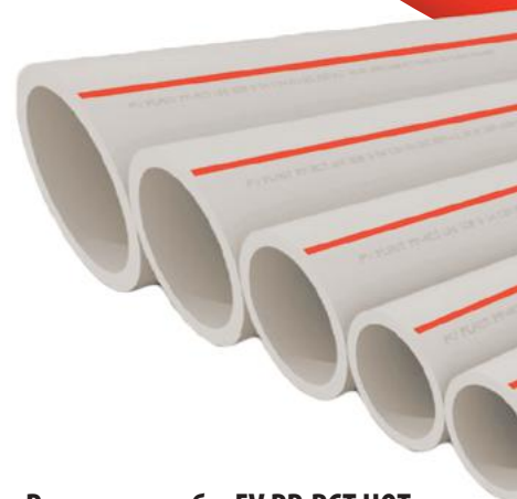
Размеры трубы FV PP-RCT HOT